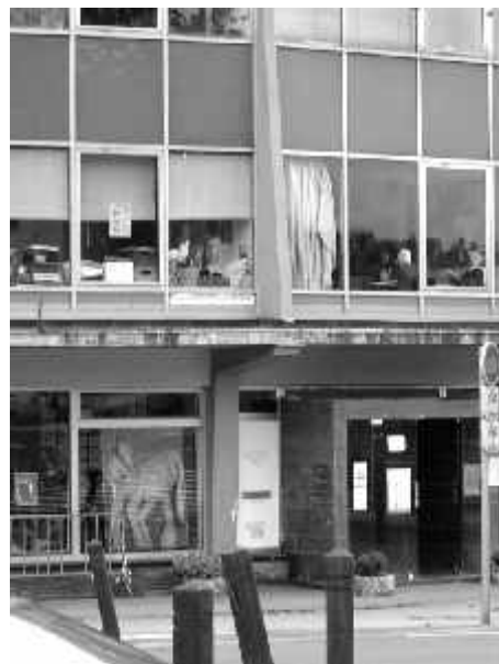
La Maison En Plus

Propos recueillis par Véronique Marissal