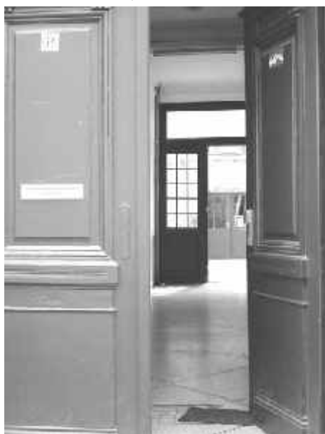
Le Local

La plupart des associations rencontrées constituent des listes d'attente, d'autres n'ont jamais été confrontées à la question ( adolescents qui ne viennent pas tous les jours, pas d'obligation de fréquentation quotidienne ), d'autres encore structurent le temps et l'espace en sorte d'être accessibles au plus grand nombre. Si les limites sont le plus souvent liées à des contingences matérielles et financières ( espace des locaux, nombre d'animateurs engagés ), la priorité donnée aux enfants déjà inscrits vient fortement conditionner l'inscription de nouveaux. Cette situation est d'autant plus forte lorsque des fratries entières s'inscrivent. Difficile de défendre à la fois l'accessibilité et la qualité d'un travail sur le long terme! Cette situation amène les associations à jongler entre intérêts du public et objectifs du projet et à définir pour certaines des critères de priorité à l'inscription. Outre l'âge ( les projets s'adressent à des enfants de tel à tel âge ), les critères les plus souvent mentionnés sont d'habiter ou d'être scolarisé dans le quartier ( parfois cette exigence est celle du P.O. ), d'avoir déjà été inscrit ou d'avoir frères et sœurs déjà inscrits et de rencontrer des difficultés ( scolaires, sociales, familiales ). D'autres critères peuvent être inhérents au projet même tel celui de La Voix des Femmes qui n'est accessible qu'aux jeunes filles, ou des